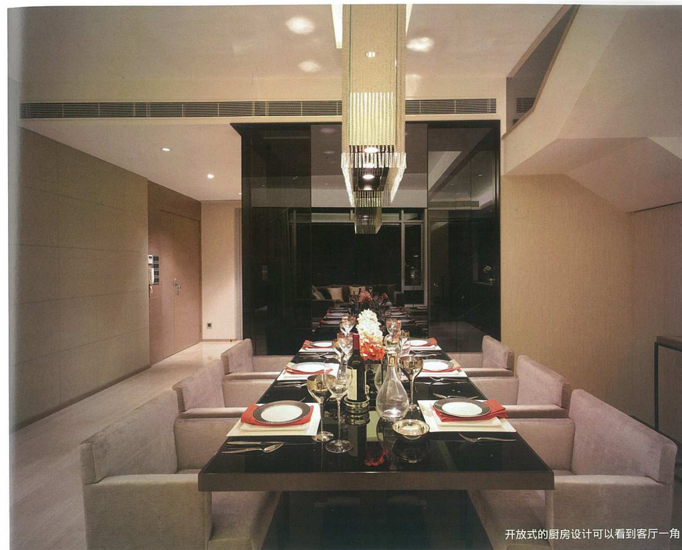
开放式的厨房设计可以看到客厅一角

HongKong is famous for its limit land resource, An apartment situated on the 62nd floor of Manhattan Hill designed by Steve Leung has the spacious and eminent view. It presents an extraordinary living experience in a claustrophobic town that no other apartments can compare with. The most important thing is that Steve use rather than luxury decoration but some magic to make the space more charming.