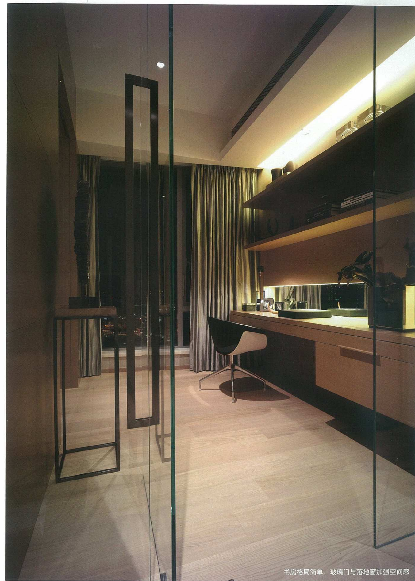
书房格局简单，玻璃门与落地窗加强空间感