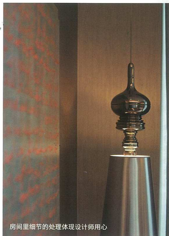
房间里细节的处理体现设计师用心