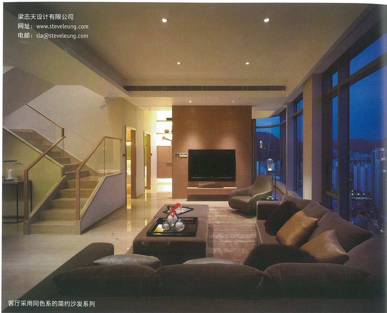
客厅采用同色系的简约沙发系列

梁志天设计有限公司 网址: www.steveleung.com 电邮: sla@steveleung.com