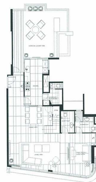
1/F Layout Plan

也许与梁的成长经历有关，本地土生土长的梁志天一再反思真正适合香港人的家居环境应该是怎样的？所以梁致力彰显完美的空间运用和光线配合。这座复式单位能够 180 度欣赏到维多利亚海港的景色，居高临下，海天一色融合于四周高高低低的楼房。此外玻璃和线条在这里也被淋漓尽致地运用，设计师在空间细处放置不同通透度的玻璃，视觉上淡化了每个特定空间之间的阻隔，增强透明度。为彰显现代设