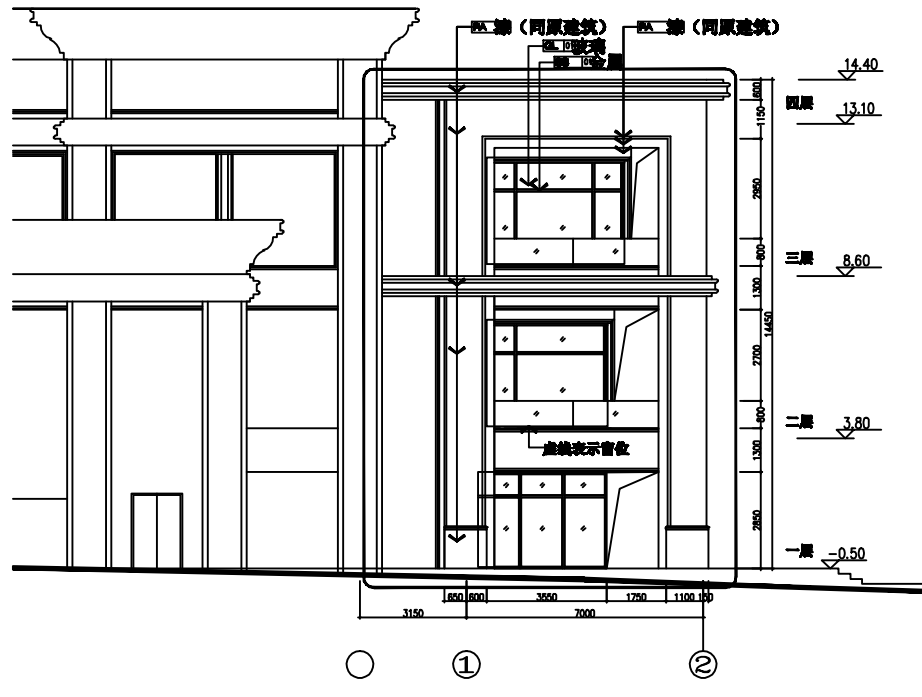
D ELEVATION 立面图 Scale 1:800(A1) 1:400(A0)