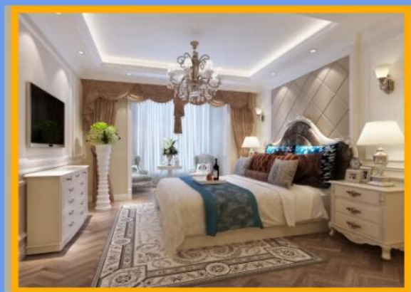
最终设计效果展示

欢迎加入室内装修设计学习群:562473596，在线分享最顶尖的设计案例、教程、干货、基础到实践，通俗易懂，学以致用。